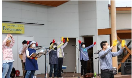
写真は5月たけふプティット・アンサンブルと武生センター合唱団とともに楽しむ参加者