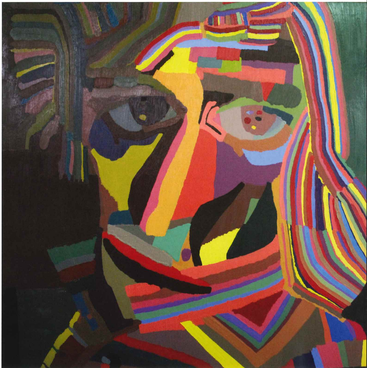
「運命に逆らって」油彩・キャンバス 森 啓輔(希望の園所属/三重)

2022年 7月16日 土 ▶ 24日 日 10:00~19:00 ※19日(火)は休館