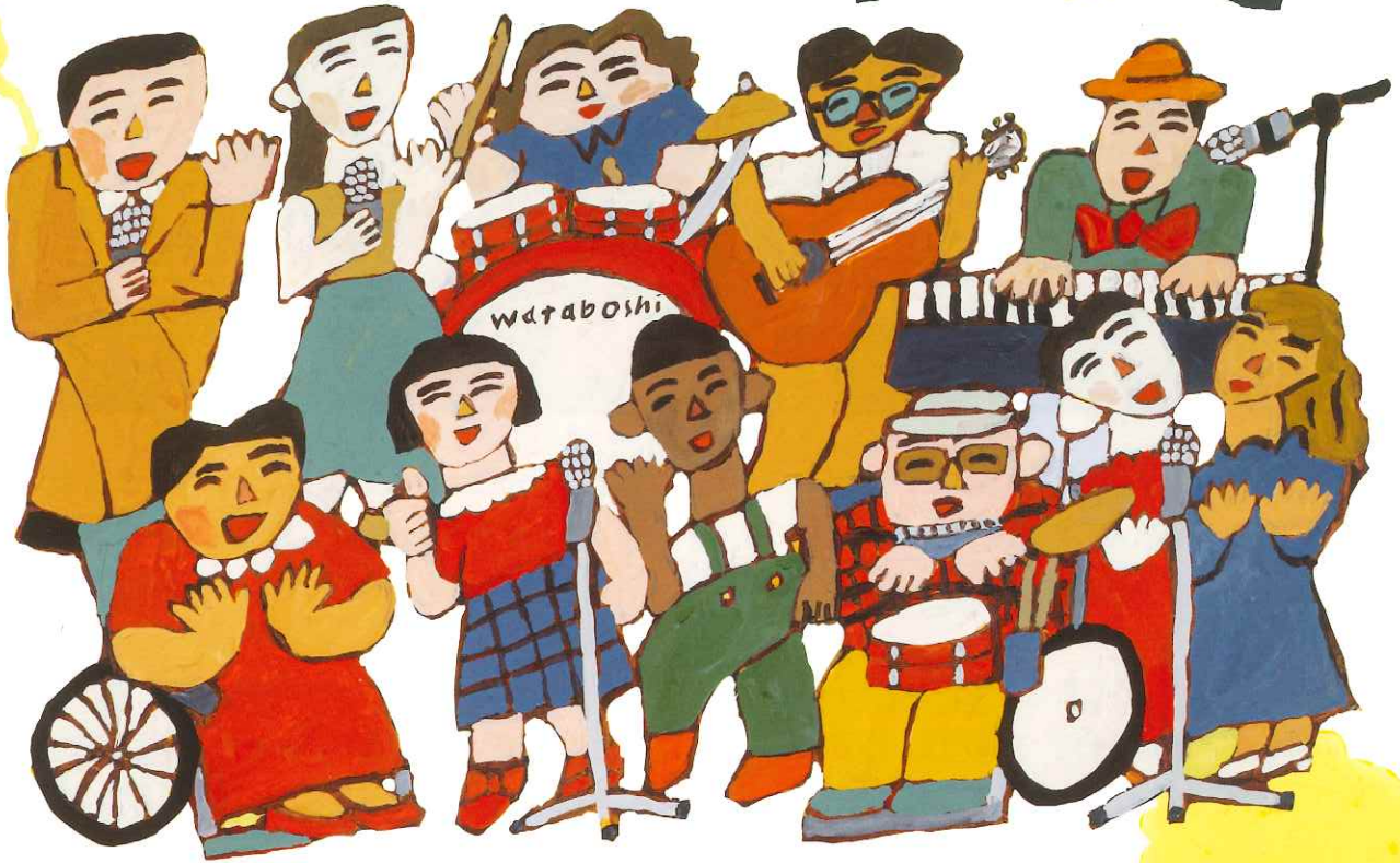
Illustration by HIRAMICHI SYOTEN Title Logo type by Nodoka Suzumura