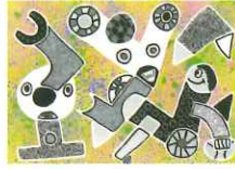
カミジヨウミカ (長野県)