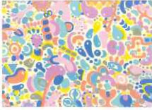
さくらゆき (山口県)