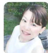
もりた 森田 かずよ (ダンサー・俳優)