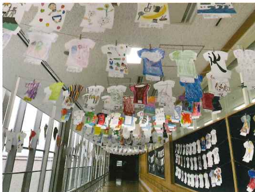
2023年度の作品展示より